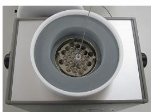
フリージング部 サンプルの温度計測が可能