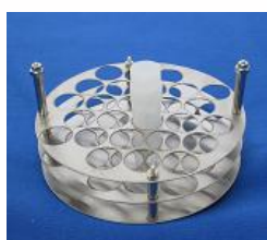
クライオチューブ 26本セットラック